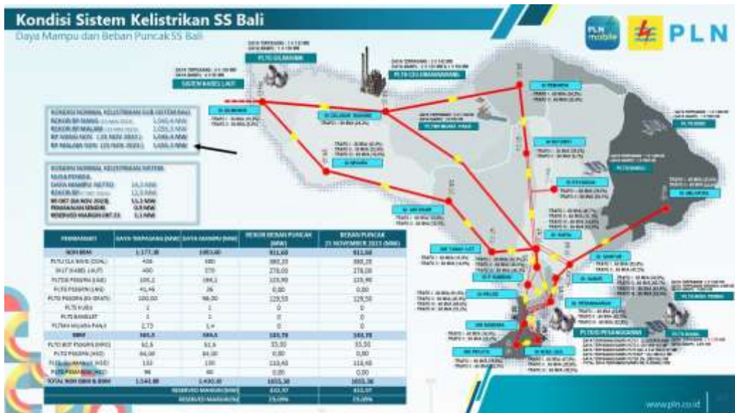
Tabel 11.1.1. : Tabel Kondisi Sistem Kelistrikan SS Bali